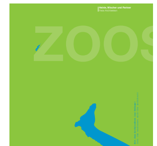
ZOOS Bauen für Tiere, 2009