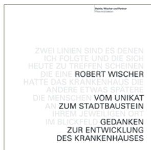
Vom Unikat zum Stadtbaustein Gedanken zur Entwicklung des Krankenhauses, Robert Wischer, 2008