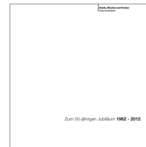
50 Jahre Unverwechselbar Heinle, Wischer und Partner, Freie Architekten, 2012