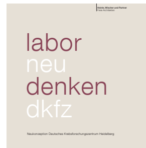
Labor neu denken Neukonzeption Deutsches Krebsforschungszentrum Heidelberg, 2013