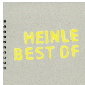
ERWIN HEINLE BEST OF Zwischen Hochgebirge und Mittelmeer - Begleitkatalog zur Ausstellung, 2018