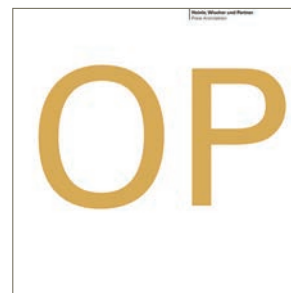
OP der Zukunft Städtisches Klinikum Brandenburg, 2007