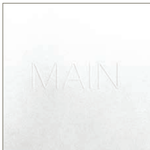
Neubau Forschungszentrum MAIN Ein Bauwerk für Dialog und Forschung, 2019

Bestellungen unter info@heinlewischer.de