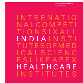
India Healthcare International Competition Six All India Institutes of Medical Sciences like Apex Healthcare Institutes, 2007